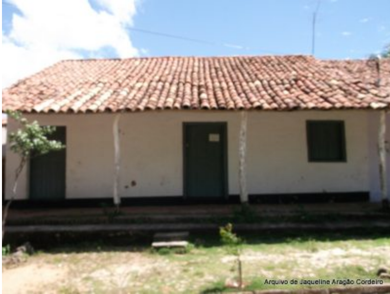
Casa do Capitão-Mor[/caption]

A Casa do Capitão-mor, conhecida também como casa da Ouvidoria, nome do primeiro núcleo judiciário do Ceará, é um singelo edifício feito com paredes de taipa (pau-a-pique), reforçada com amarras de couro de boi, uma referência material ao ciclo econômico das charqueadas, o qual predominou na região durante o século XVIII.