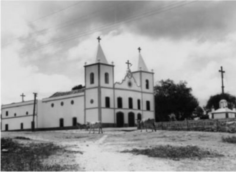
Igreja Matriz São José de Ribamar[/caption]

Aquiraz é conhecida como "a primeira capital do Ceará". Em seu perímetro central, situado em torno da Praça Cônego Araripe, a qual tem traçado de missão jesuítica, encontram-se as principais edificações de interesse histórico arquitetônico do local, como a igreja São José de Ribamar, Matriz de Aquiraz, obra de rico valor histórico, pois sua construção data de 1769 e ainda guarda nos seus altares as velhas imagens do Hospício dos Jesuítas.