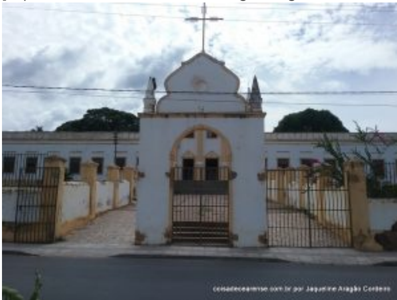
Seminário São José[/caption]

[caption id="attachment_4953" align="aligncenter" width="400"]