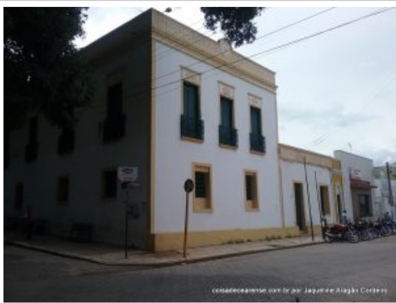
Casa de Câmara e Cadeia - Atualmente é

um museu com peças que datam do século XVIII e XIX[/caption]