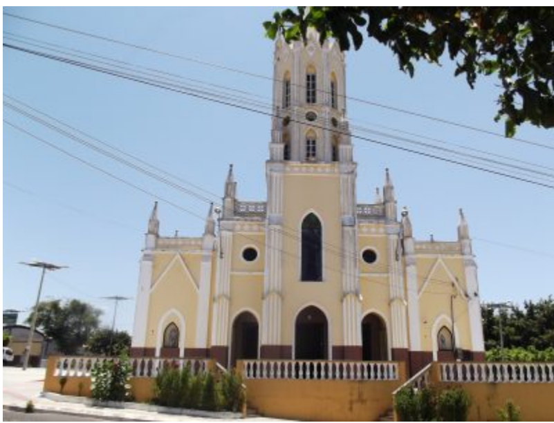
Igreja Matriz de São Benedito

[caption id="attachment_7833" align="aligncenter" width="400"]