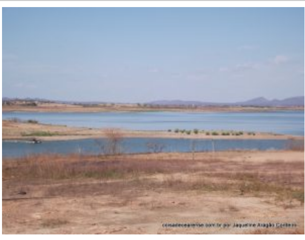
Açude Lima Campos - Dezembro/2016[/caption]

Na época, o uso de equipamento de terraplenagem ainda marcava os primeiros passos no DNOCS. Para a construção desta obra foi empregado o sistema de compactação manual, aproveitando assim a mão-de-obra disponível criada pela seca que se abateu sobre o Nordeste. O açude tem capacidade para armazenar 66 milhões de metros cúbicos de água.