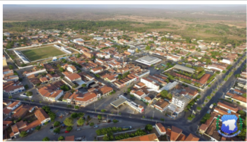
Vista aérea da cidade[/caption]

[caption id="attachment_8995" align="aligncenter" width="400"]