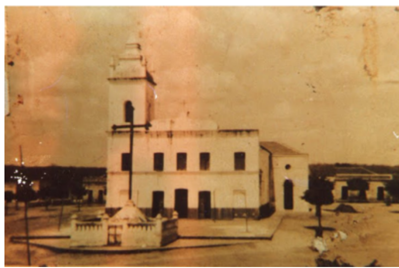
Igreja Matriz de Nossa Senhora da

[caption id="attachment_8998" align="aligncenter" width="400"]